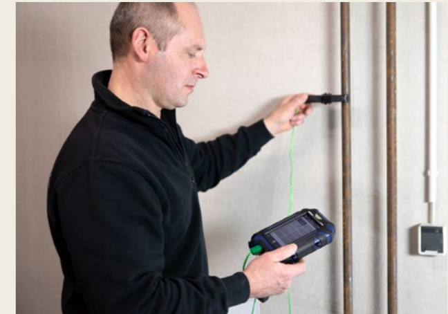
Mit der Temperaturmesszange lässt sich die Rohrtemperatur bestimmen.