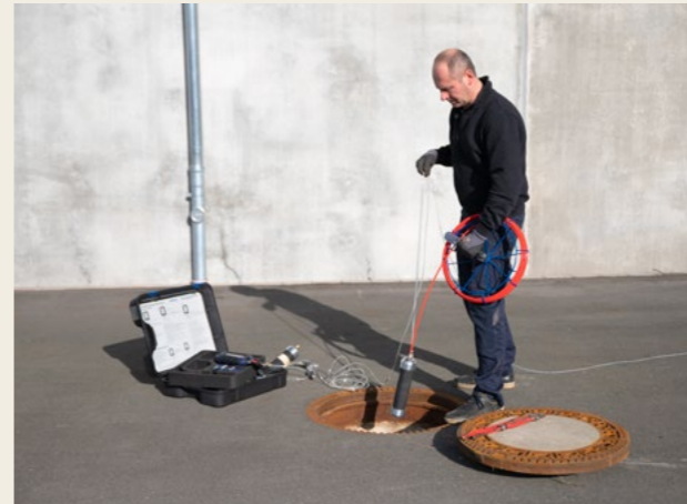
Vor der Dichtheitsprüfung an Abwasserleitungen nach DIN EN 1610 werden die Prüfabschnitte mit Blasen abgedichtet.