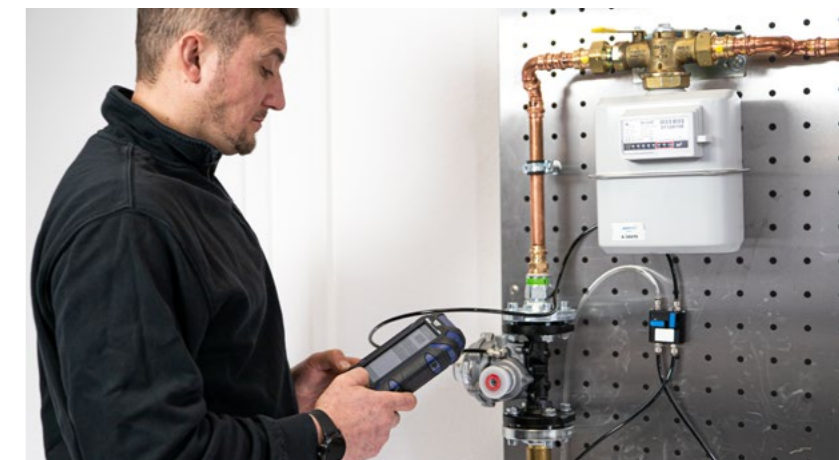
Ein eigener Menüpunkt sorgt dafür, dass die Funktionsfähigkeit des Gasreglers inkl. SAV-Prüfung in wenigen Minuten getestet werden kann.